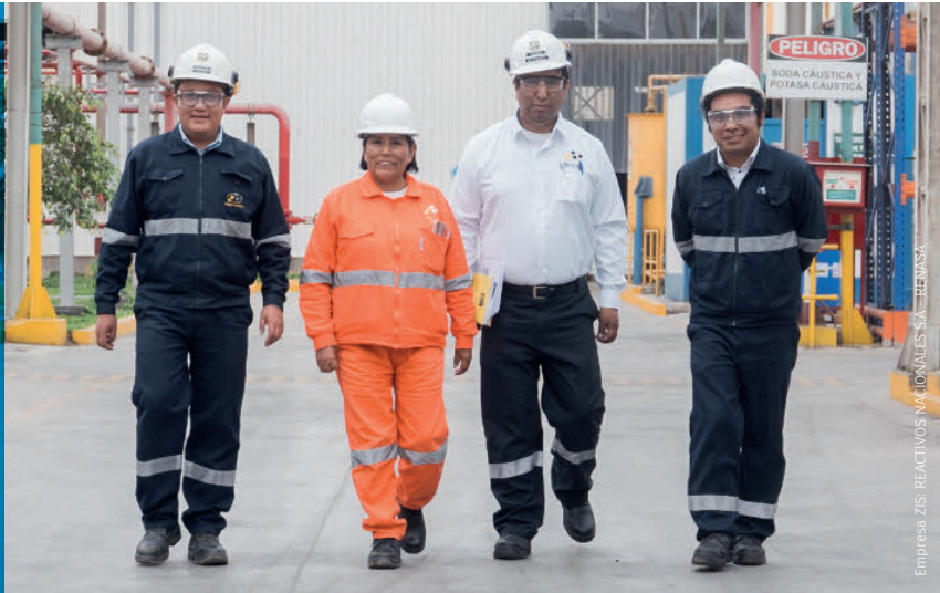
Empresa ZIS, REACTIVOS NACIONALES S.A. - REMASA