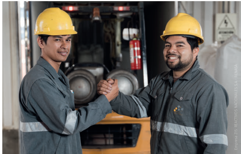
Empresa ZIS, REACTIVOS NACIONALES S.A. - REMASA