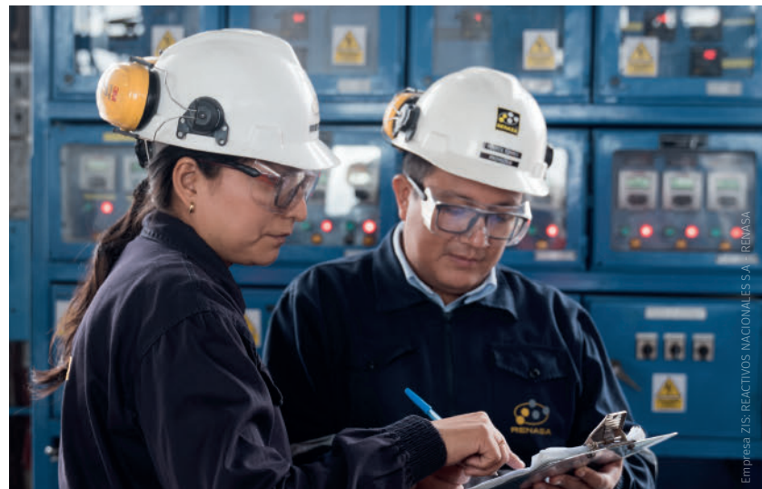
Empresa ZIS, REACTIVOS NACIONALES S.A. - REMASA